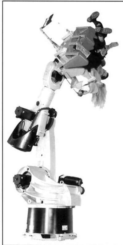
„Hals über Kopf“ verleiht der KUKA-ROBOcoaster, einen noch nie dagewesenen Fahrspaß

Ingenieure, Designer und Programmierer arbeiten bei jedem Projekt eng zusammen. Gemeinsam entwerfen sie Konzepte, bewerten Angebote, entwickeln Inhalte, Dramaturgien, Szenen, Design und kümmern sich um